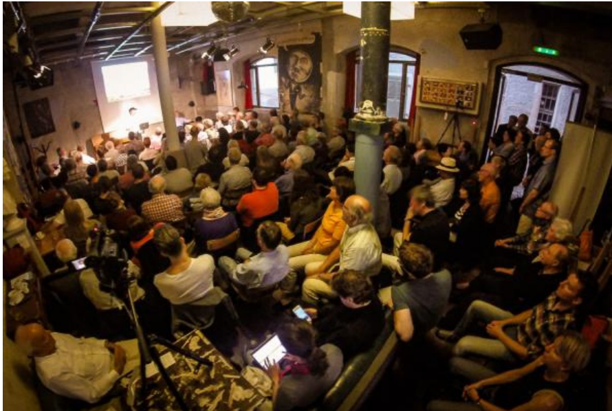
Zürich, Cabaret Voltaire