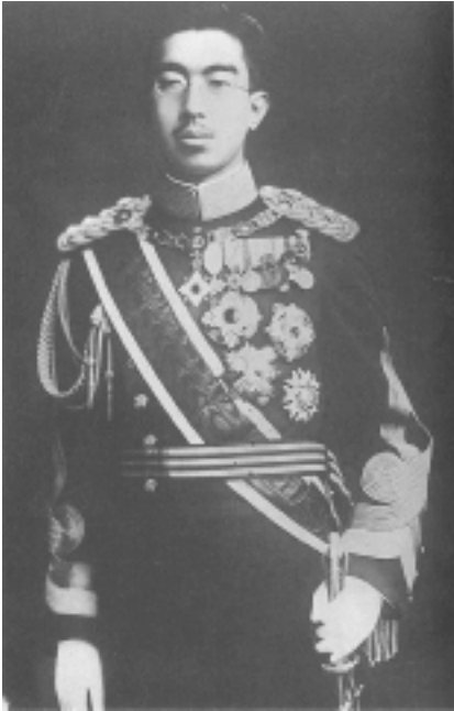
Hirohito, Jap. Kaiser 1926-89