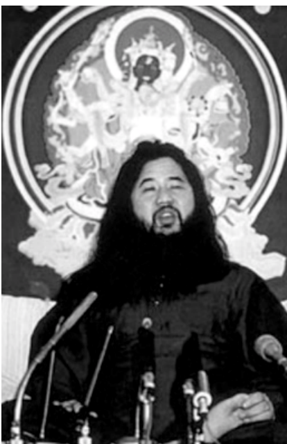
Aum-Sektenführer Shoko Asahara

Herausragend bezüglich Bio-Terror ist sicher Japan: Dort ticken die Uhren noch einmal etwas anders – und nicht erst seit Ausbruch der AIDS-Pandemie: Der (glücklicherweise) misslungene Bio-Waffeneinsatz jener japanischen "Aum"-Sekte, welche mit ihrer Sarin-Nervengift-Attacke in der Tokyoter U-Bahn, anno 1995, weltweit Aufsehen erregt hatte, schockierte auch nicht-japanische Behörden vor allem durch die Existenz von jahrelang gehegten und gepflegten Bio-Terrorplänen.