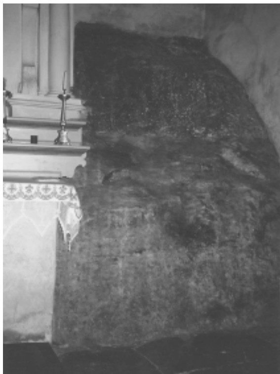
Pietra della fertilità nella Chiesa di S. Vittore, Grigioni Italiano