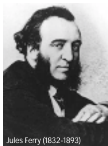
Jules Ferry (1832-1893)

I due grandi riferimenti storici sono stati, il discorso di Victor Hugo al Senato contro la legge Falloux (1850) 2 e la "Lettre aux enseignants des écoles élémentaires" di Jules Ferry (1883) 3 .