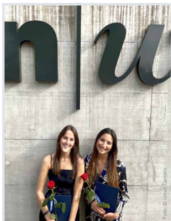
Die Studien-Autorinnen an ihrer Bachelor-Feier.

*SWOT: Strengths, Weaknesses, Opportunities, Risks (Stärken, Schwächen, Chancen, Risiken)