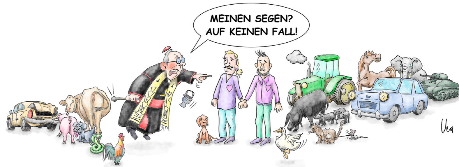
Karikatur: © Vera Bueller, selezione.ch

Hier finden Sie die Links zu den neuesten Medienbeiträgen, die die Freidenkenden Schweiz betreffen: www.frei-denken.ch/medienecho