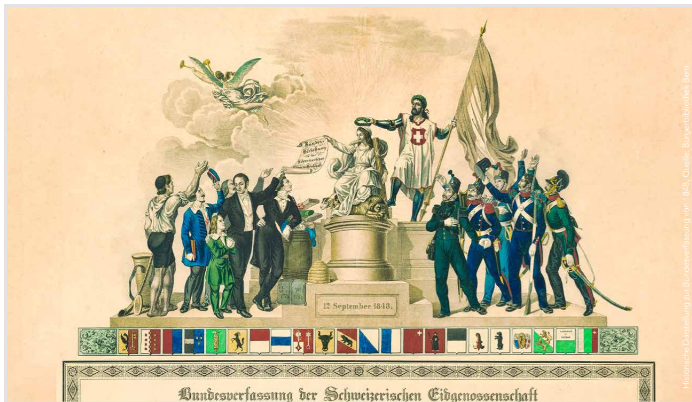
Historische Darstellung zur Bundesverfassung von 1848.