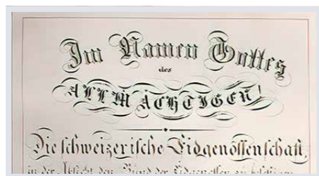
Braucht es Gott in der Verfassung? Gott in Europa und in den Kantonen Seite 18