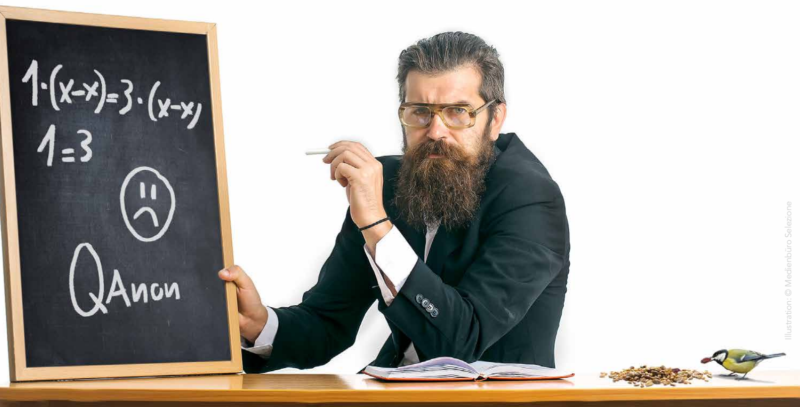
Illustration: © Medienbüro Selezione