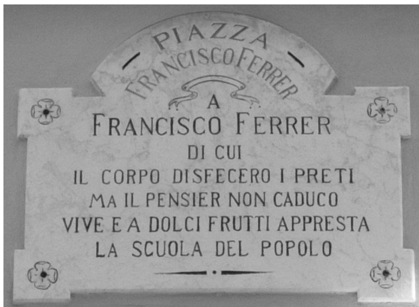
Piazza Ferrer, Novaggio